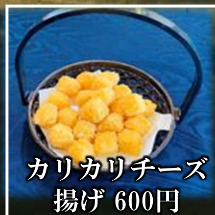
カリカリチーズ 揚げ 600円