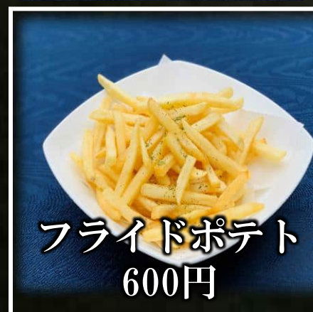
フライドポテト 600円