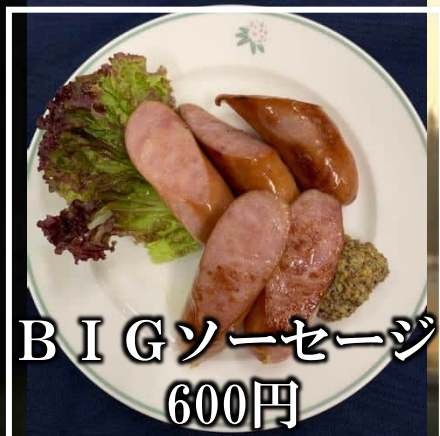
B I Gソーセージ 600円