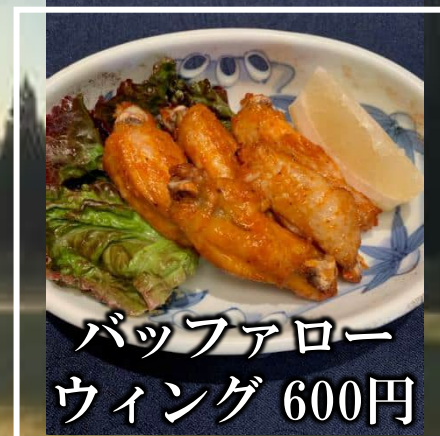
バッファロー ウイング 600円